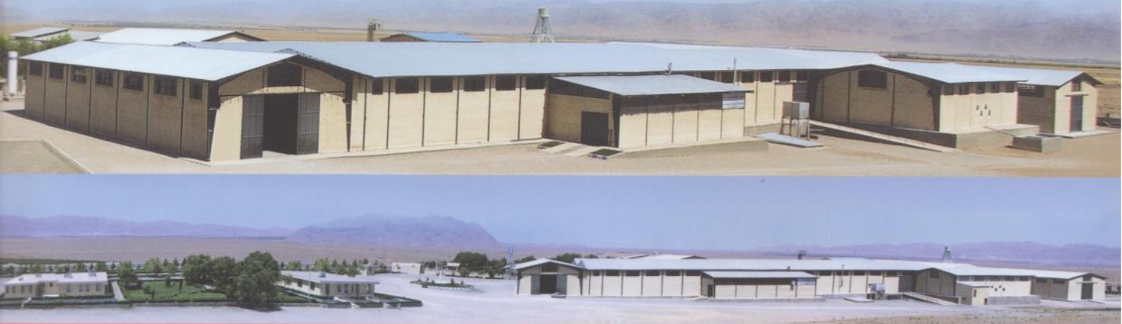
سانيج جم : اولین تولیدکننده لوله استیل در ایران